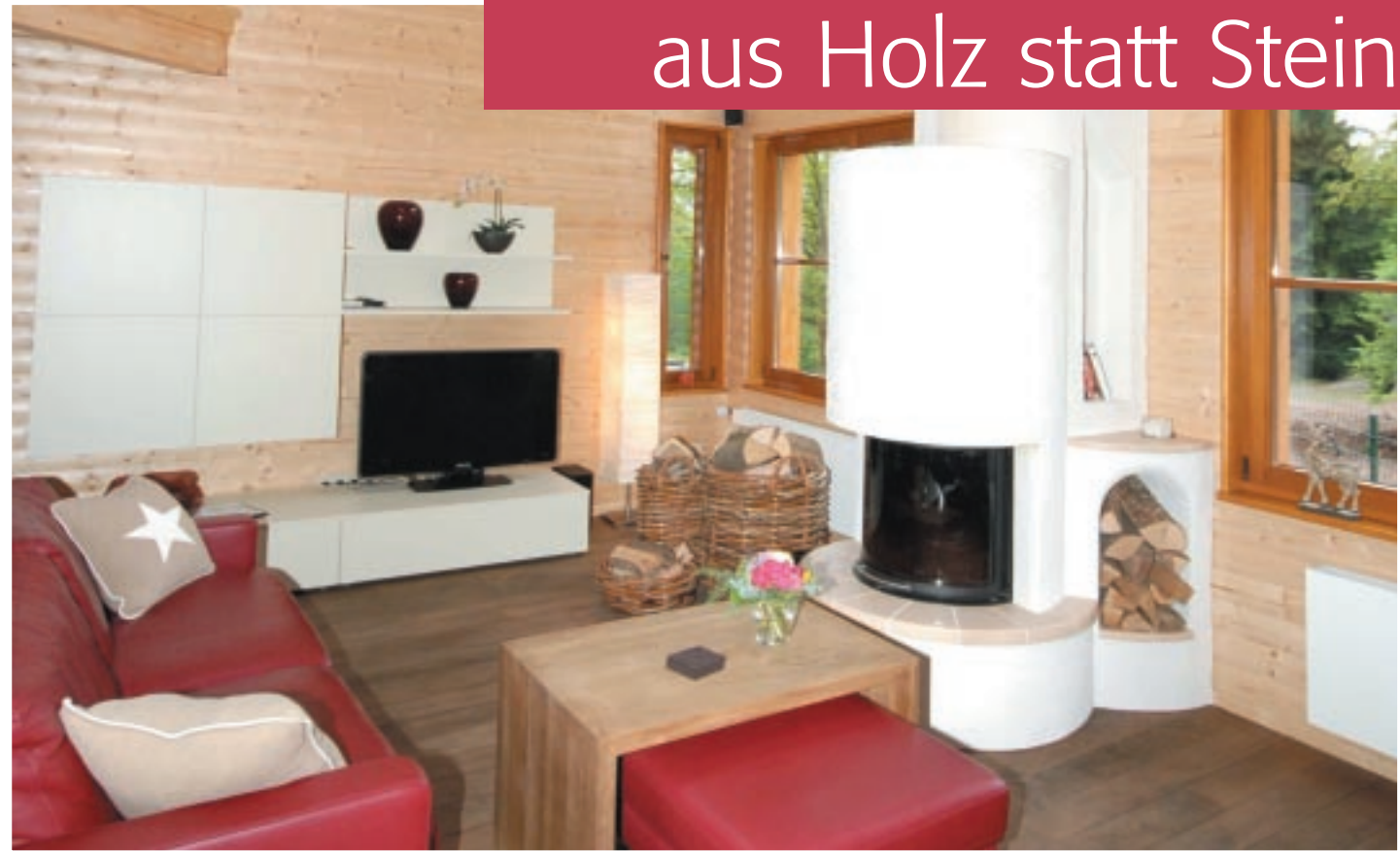
Wohnzimmer mit rundem Kamin