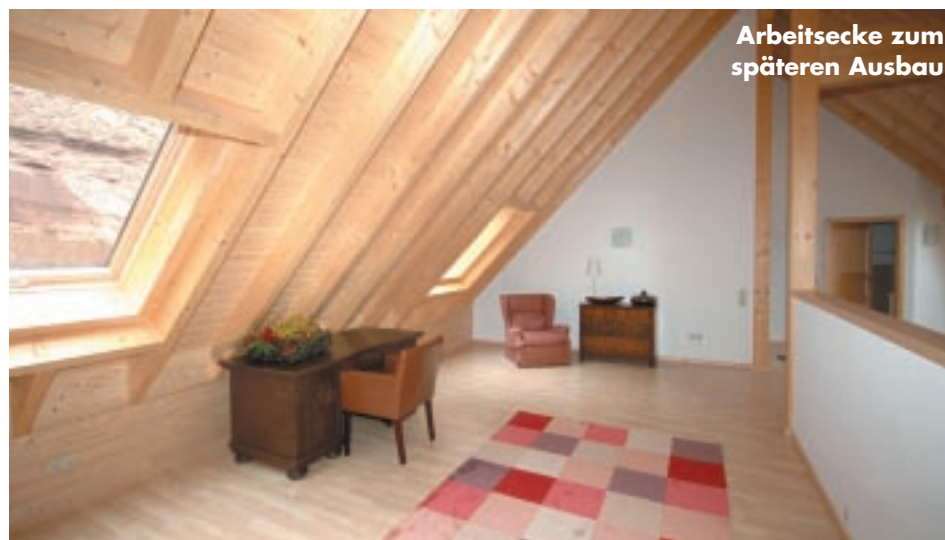
Arbeitsecke zum späteren Ausbau

Der u.a. für seinen dämmstarken, mehrschaligen Wandaufbau bekannte Ingenieur- und Meisterbetrieb hat die diesbezüglich erfahrene Bauherrin mehr als beeindruckt. Die rundum überdurchschnittliche Dämmung liegt bei weitem über den vorgegebenen Werten der Energie-Einsparverordnung und hilft dabei den Heizenergieverbrauch massiv zu senken. Ein weiteres Schlafzimmer mit eigenem Bad schließt die obere Etage ab, wobei die baulichen Voraussetzungen dafür geschaffen wurden, bei Bedarf zwei weitere Räume im Obergeschoss zu integrieren. Die Statik und Konstruktion erlauben dies.