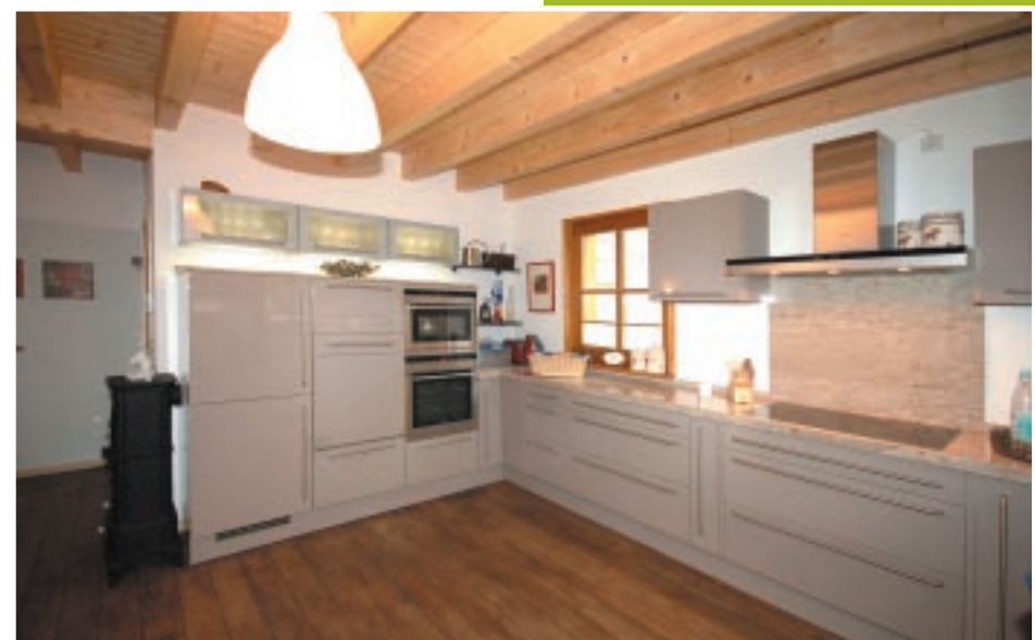
Große, moderne Küche