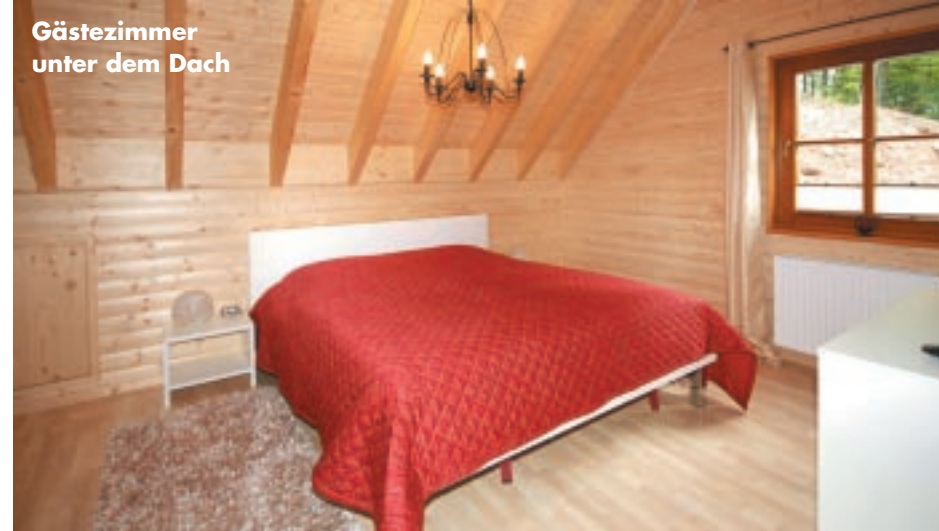
Gästezimmer unter dem Dach

Ulrike Korbmacher kann ihr neues Traum-Domizil nun doppelt genießen: Zum einen das gesunde Blockhausklima und zum zweiten die Gewissheit, einen greifbaren Beitrag zu einer vorbildlichen ökologischen Wohn- und Lebensweise geleistet zu haben. BH