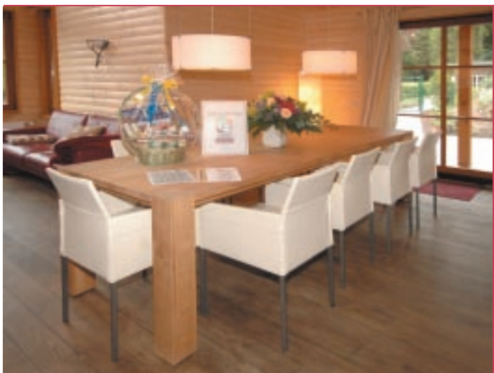
Esstisch im Future-Stil