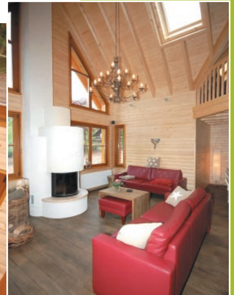
Ausleuchtung über Dachfenster

Zwei links und rechts vom Querhaus platzierte großzügige Terrassen garantieren fast gantztägig vollen Sonnengenuss. Das Gäste-WC direkt neben dem Eingangsbereich, ein hinten gelegenes, ruhiges Schlafzimmer und eine gediegene Bad-Saunen-Kombination runden den stimmigen Gesamteindruck im Erdgeschoss ab. ▶