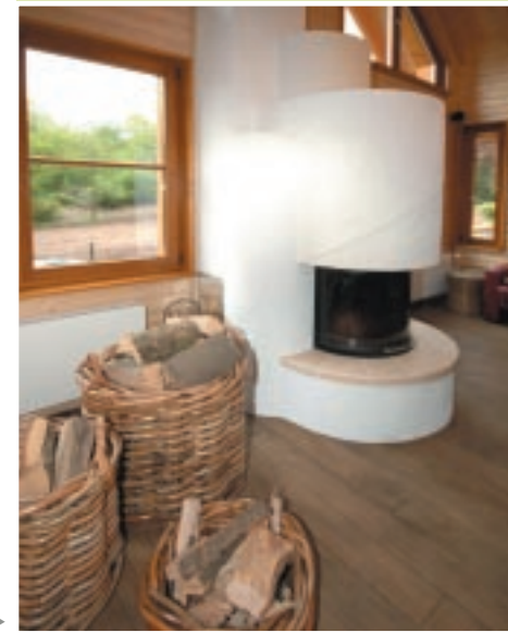
Holzheizen ist selbstverständlich

Da diese Erfahrung dem Bauunternehmer noch fehlte, begab man sich auf die Suche nach einem geeigneten Anbieter. Es folgten eine ausgiebige Recherche, zahlreiche Telefonate, Gespräche und Beratungstermine. Und als man sich fast schon mit einem finnischen Anbieter handelseinig geworden war, geschah es: Der Vater fuhr durchs 'Ländchen' und erspähte dort