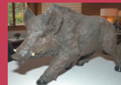
Tierlieber Keiler statt Trophäe