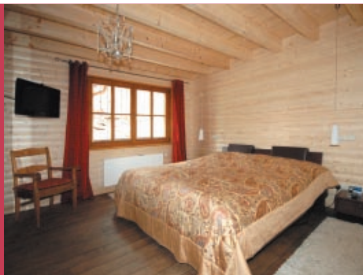
Schlafzimmer im Erdgeschoss